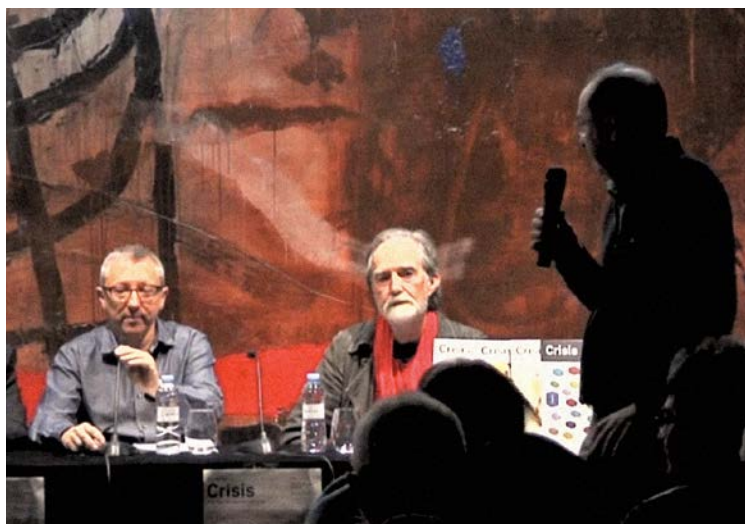
Un momento de la presentación.