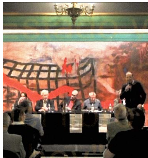
Presentación de la mesa

“ El libro, como la educación pública, las bibliotecas públicas, es también un problema social e institucional. ”