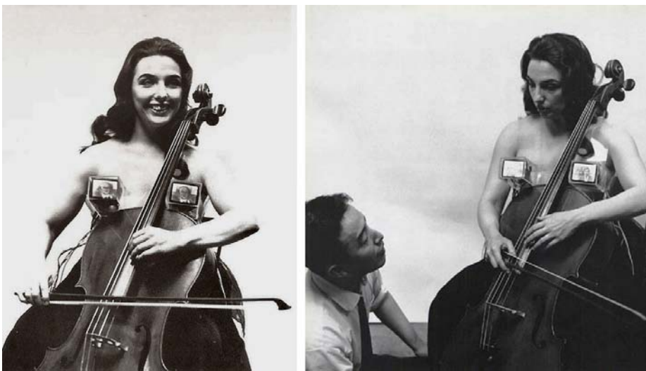
Nam June Paik y Charlotte Moorman. 1969

Acrescentar, señoras y señores y como bien ha aplastado Paul Virilio, no es que te caiga toda una información a toneladas encima. La famosa aldea global es eso, aldea si no entiendes, si no te dejan comprender que quienes está al otro lado, a cien mil kilómetros o exactamente junto a tu cuerpo, hablan el mismo lenguaje que tú, aunque tengan que aprender algo: Lapao o Lappapy, ese juego de neolenguaje aragonés que nos trae muy distraídos últimamente.