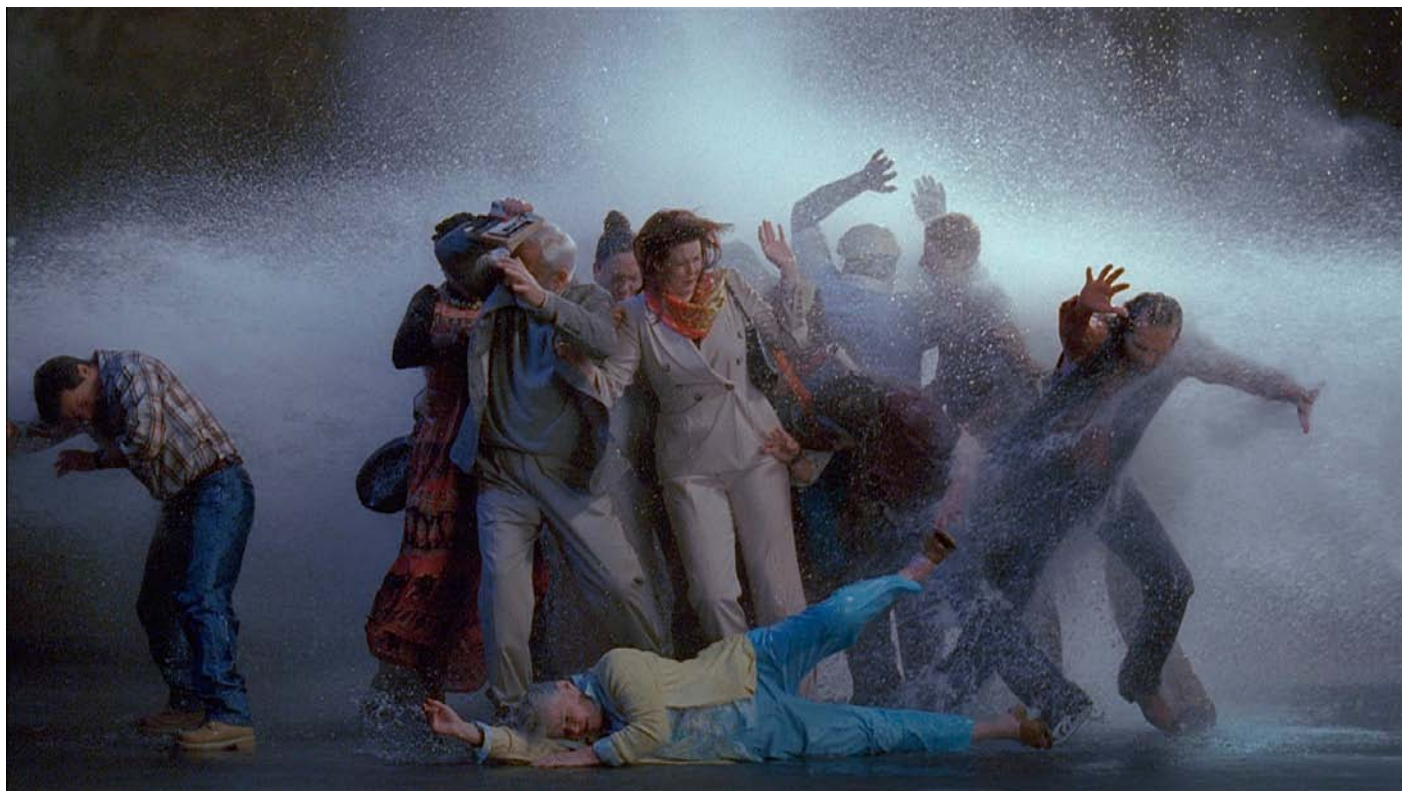
Bill Viola. Tempest Study for the Raft. 2005

conceptuales, los visionarios de una nueva imagen y los luchadores documentalistas, tan mal vistos hoy tanto por la ideología dominante como por los ladroncillos que han intentado vivir a costa del nombrecillo y el nombrecete poniendo alfombra roja a un suelo que no existe. O si existe no está en esos salones. Los de la vida.